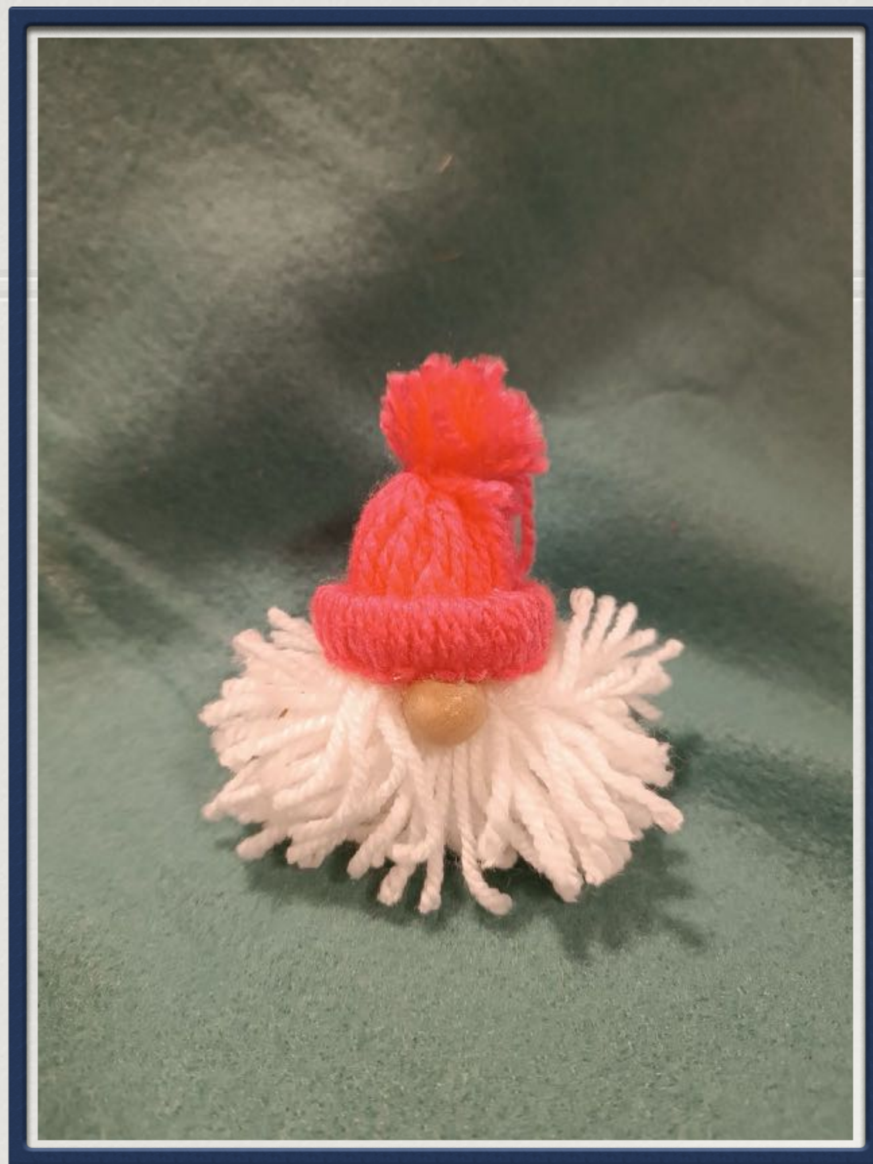
Božićni ukrasi od vune