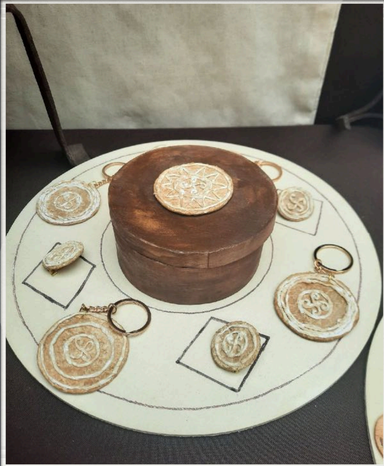
Kolekcija LOPAR Nakit