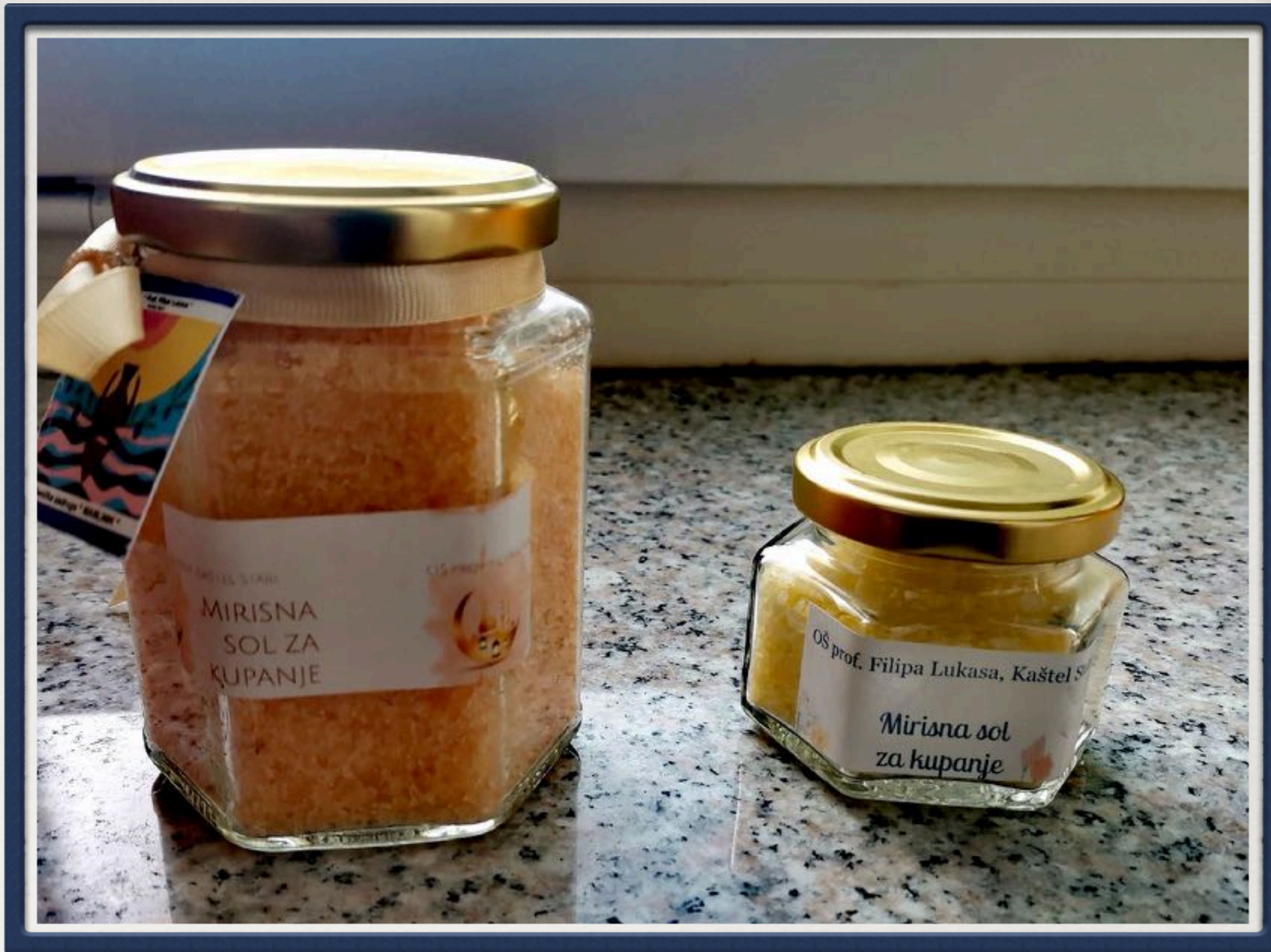
Mirisna sol za kupanje