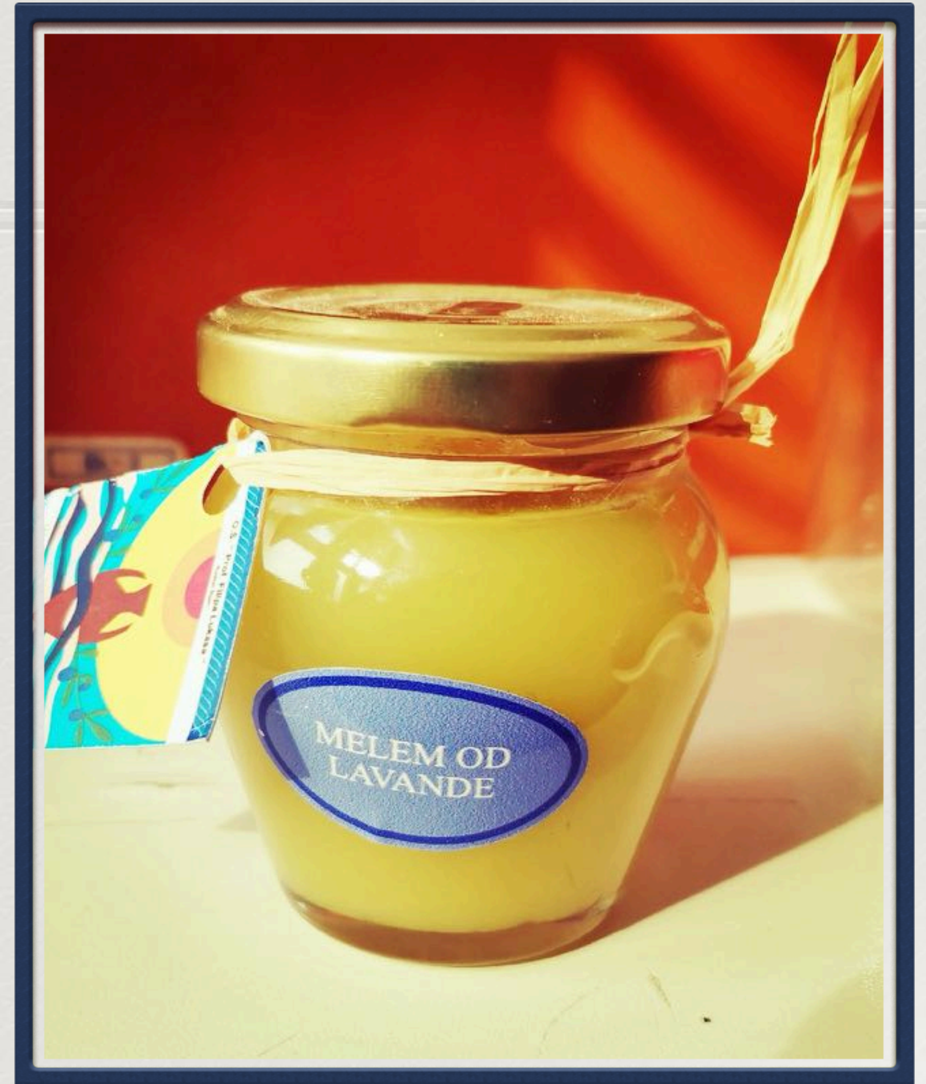
Melem od lavande