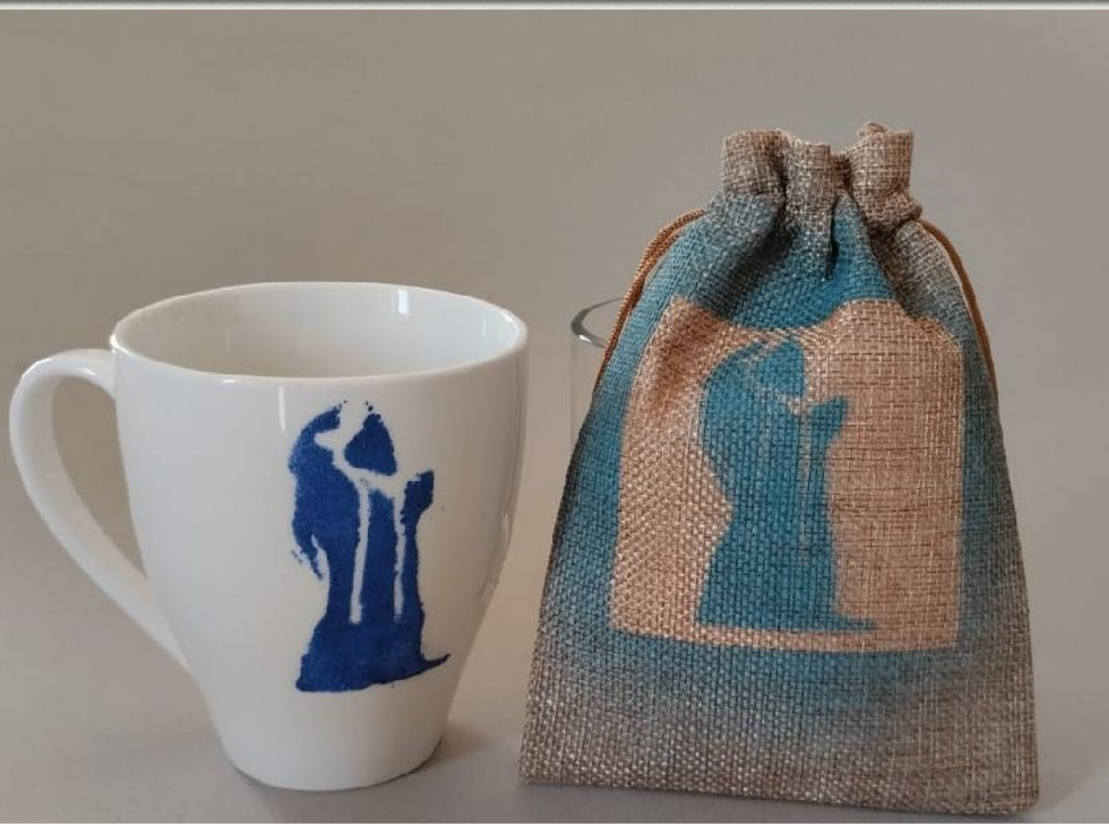
Suveniri Grgur Ninski